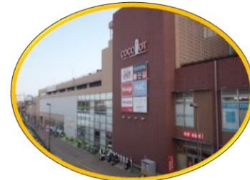
駅前複合商業施設「ココロット鶴ヶ峰」♪