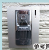
カラーモニターインターホン