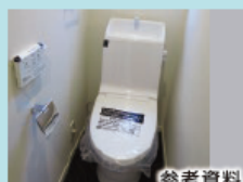
ウォシュレット付トイレ