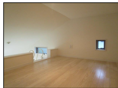
※図面と現況が異なる場合は現況を優先します。