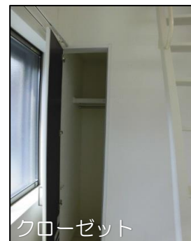
※内装写真は同建物内、別室の写真です