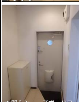
玄関&シューズボックス