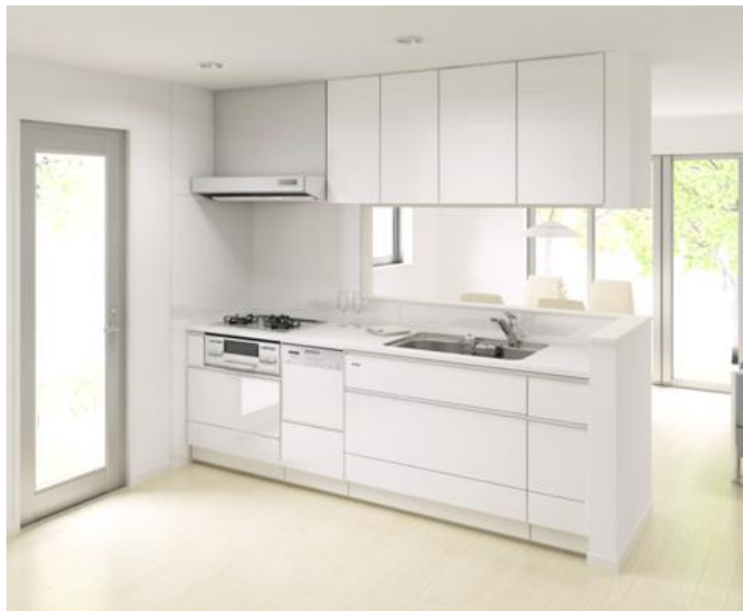
*写真はイメージですので仕様とは一部異なります。